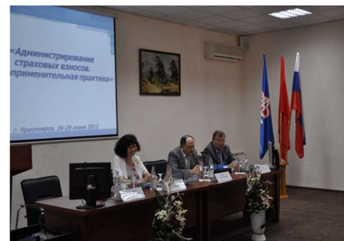
На фото: Открытие семинара

По мнению участников семинара, такие мероприятия помогают найти оптимальный способ решения той или иной проблемы, обменяться опытом и обсудить идеи, которые в будущем помогут сделать работу более эффективной.